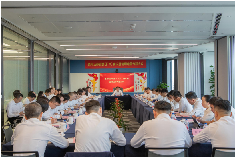
德邦证券召开党委扩大会议暨管理运营专题会议