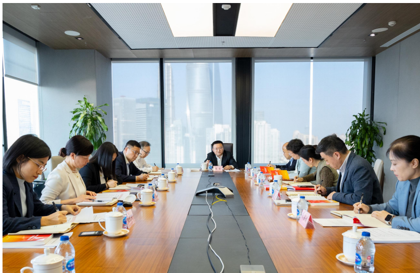
德邦证券党委理论学习中心组进行集体学习

实5方面21项具体任务，相关工作经验获《中国证券报》刊发。常态化开展党委理论学习中心组学习，聚焦党的二十届四中全会精神开展专题研讨，推动理论学习入脑入心、走深走实。