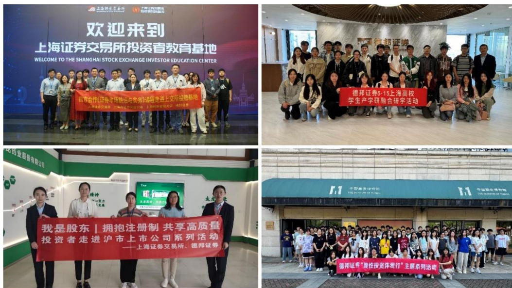
公司积极开展投资者教育活动

投资者教育层面，在各级监管机构、自律组织、交易所的指导和部署下，公司积极开展多层次、多形式、多渠道的投资者教育活动：全年制作投教产品2750种，发放实物4.3万件，吸引1582万人浏览；累计举办线上线下活动2145场，服务社会公众超55万人次。深耕乡村防非宣教，在江西莲花县开展“乡村振兴防非公益行”系列活动，守护群众“钱袋子”；积极响应中国证券业协会“投资者教育进百校”倡议，开设课程72场，常态化推进金融知识纳入国民教育体系，充分践行以人民为中心的发展理念。