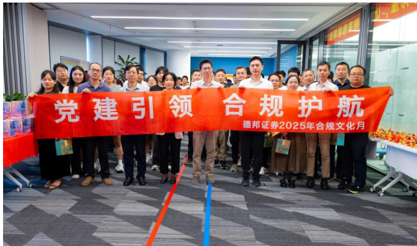
“党建引领 合规护航” 合规文化月活动

三是建立健全合规考核机制。严格落实年度建设目标，持续优化合规考核指标，进一步明确奖惩标准，健全完善激励约束体系，切实发挥考核指挥棒作用，推动合规考核机制不断完善，为合规文化建设提供坚实制度保障。