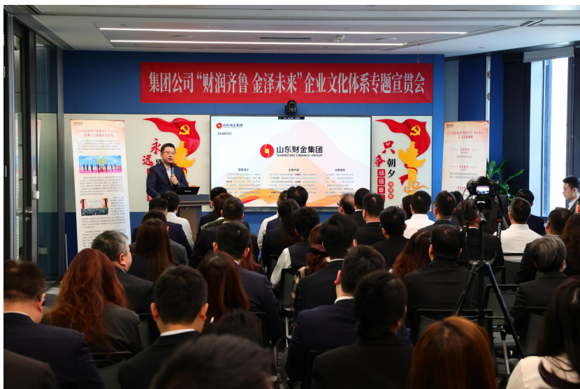
公司召开“财润齐鲁 金泽未来”企业文化专题宣贯会议

面对跨地域、多层级的组织特征，公司召开“财润齐鲁 金泽未来”企业文化专题宣贯会议，充分发挥企业文化“润物细无声”的引领创效作用，凝心聚力推动公司高质量发展。推动各部室将文化价值主张拆解为可执行、可考核的具体行为指引，有效破解大型机构文化“穿透难、落地浅”的共性难题，为行业提供了可复制的融合样本。